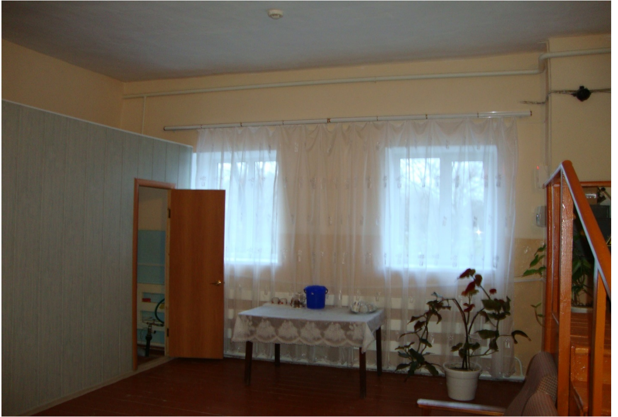
Фото № 21