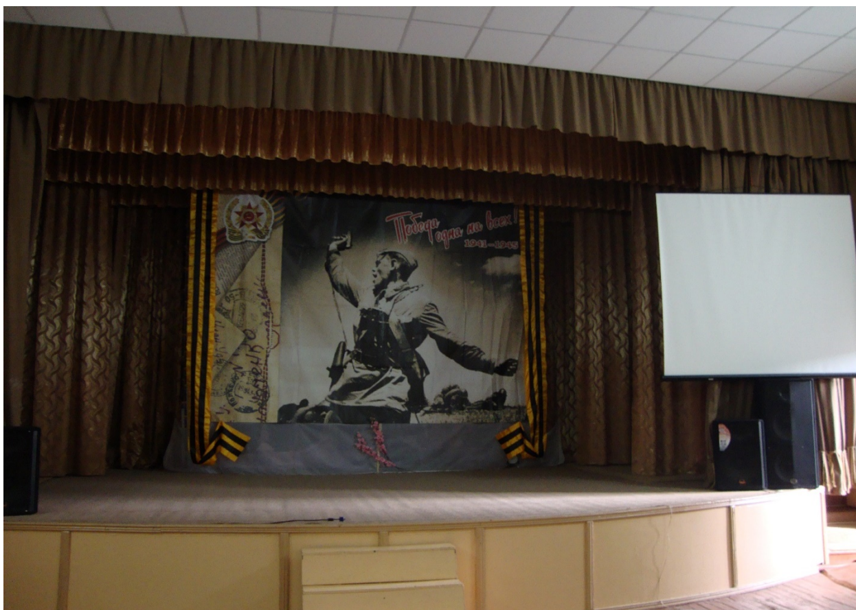
Φοτο № 12