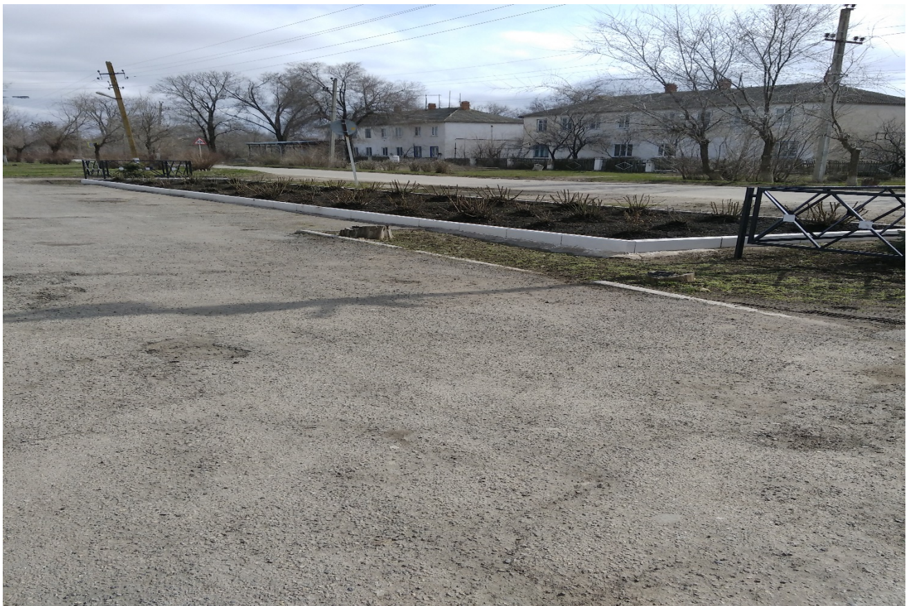
Φοτο Νο 4