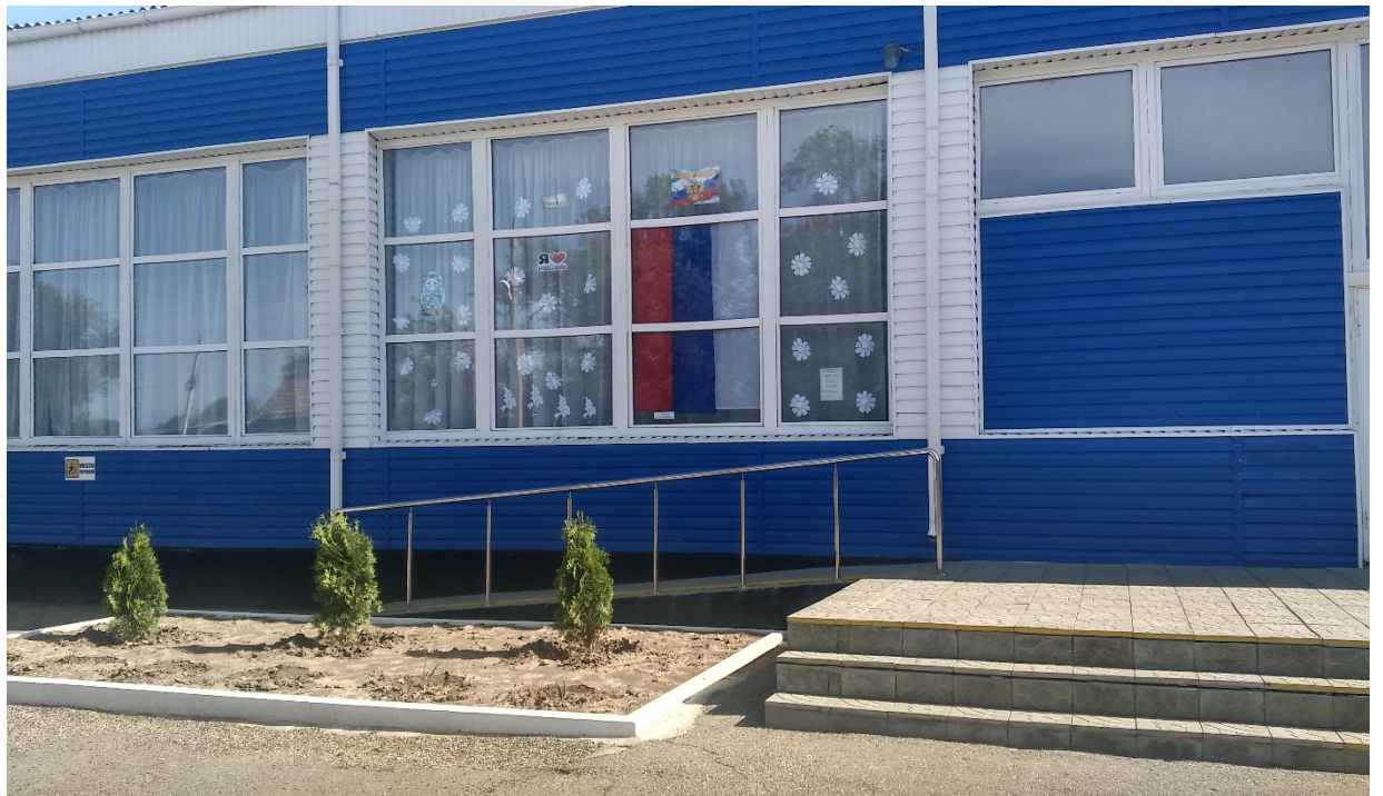
Фото № 22