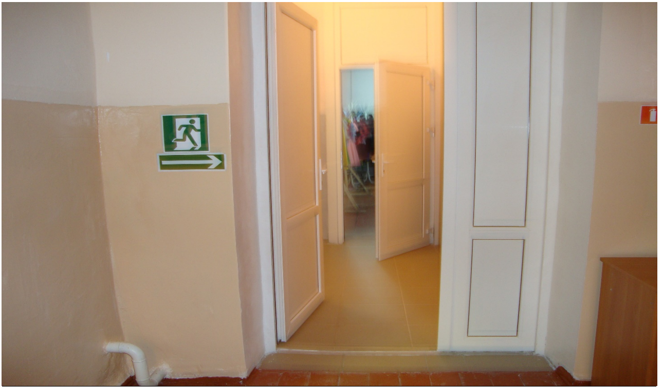
Фото № 19