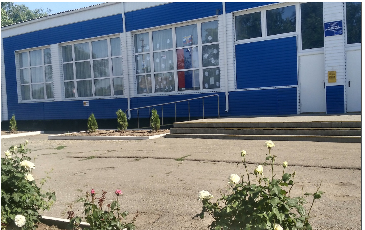
Фото № 20