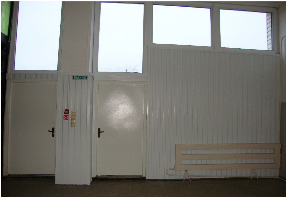
Фото № 16