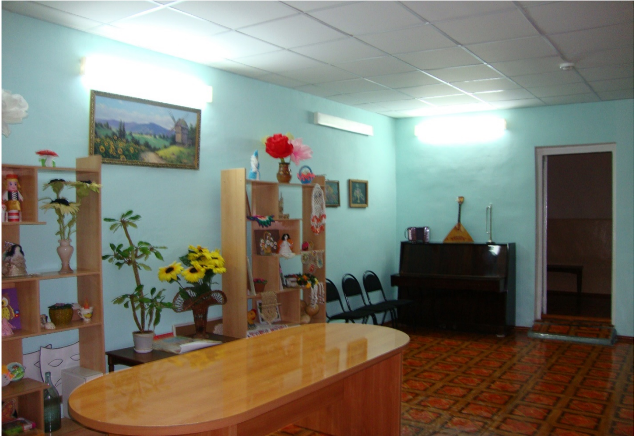
Фото № 13