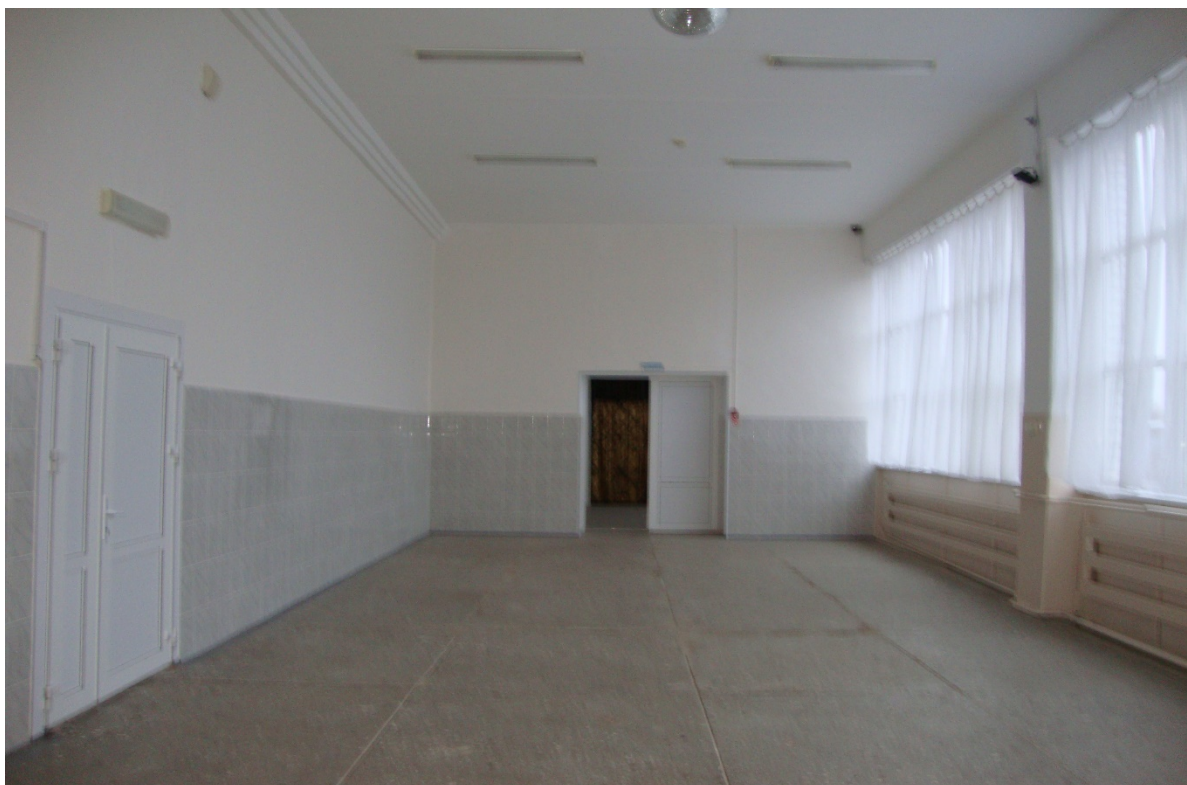
Φοτο Νο 17